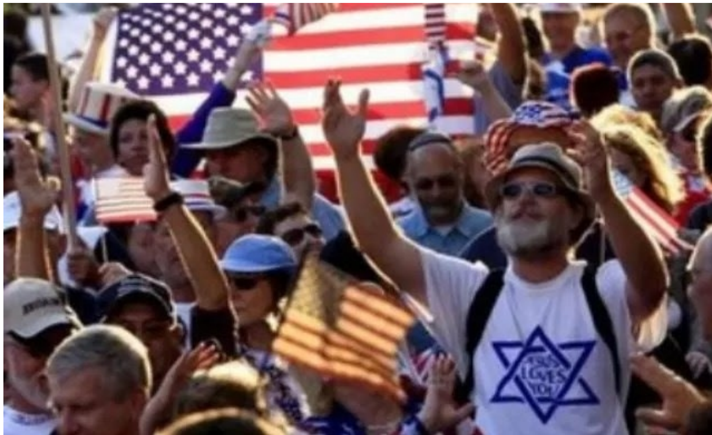
Sionistas cristianos en Estados Unidos: una mezcla que apoya la criminalidad israelí.

El concepto de libertad para Washington y con ello lo que las empresas de ese país entienden, con el lobby sionista detrás de sus acciones, refiere al sometimiento de los dictados y decisiones que este contubernio trata de imponer al mundo.