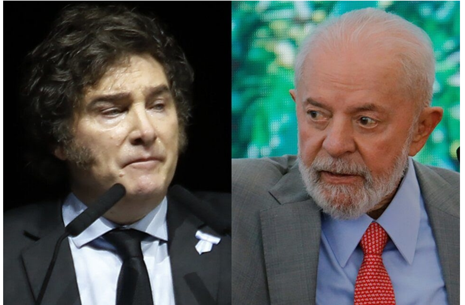
Milei sigue armando el búnker donde se refugien los fascistas de todo el mundo.

Y asegura que fue en busca de la libertad que rompió la tobillera