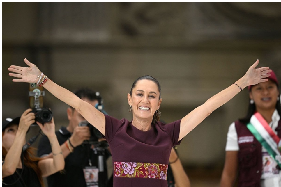
El triunfo de Claudia Sheinbaum sacó de quicio a la derecha mexicana.

El triunfo de Claudia Sheinbaum en las elecciones presidenciales de México, con más de 35 millones de votos y una diferencia superior al 30 por ciento de sufragios sobre la panista Xochill Gálvez, ha generado reacciones diversas, a veces extremas y ridículas. Otras han sido matizadas por parte de las dirigencias mediáticas, políticas, y empresariales.