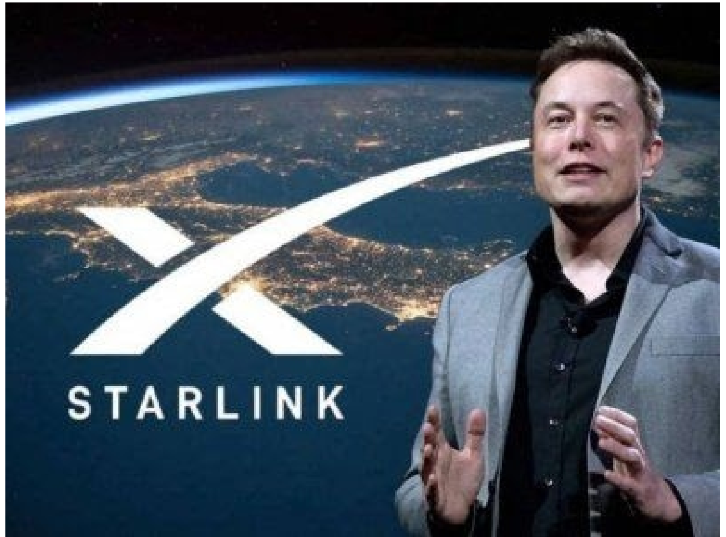
Elon Musk y su Starlink: al servicio del genocidio israelí pero también de la locura nazi de Zelenski.

La pregunta que surge es: ¿Fue esta aprobación tan publicitada de Starlink en Shifa una salva de