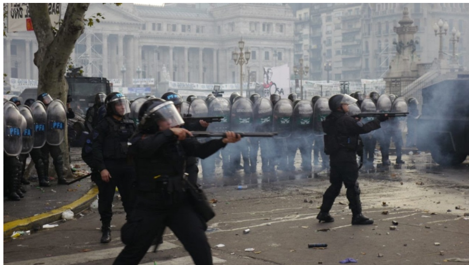
Los fusileros de la ministra del odio, atacando al pueblo a mansalva.

La nefasta ley Bases fue aprobada después de un cabeza a cabeza de 36 votos entre oficialismo y oposición, y el posterior voto de desempate de la vicepresidenta Victoria Villarruel. Inmediatamente después, vinieron en catarata la temida ley de Facultades Delegadas, por la cual el presidente Javier Milei puede hacer y deshacer a su gusto, el Rigi de la entrega de todo el patrimonio nacional, la ley de Reforma del Estado, para que no quede nada de él, la de obra pública, la reforma laboral, que golpeará de lleno a las y los trabajadores, y otras tan destructivas como las anteriores. No conformes con esa victoria pírrica pero victoria al fin, la ultraderecha ya ha anticipado que todos los recortes que se le hicieron a la ley aprobada, serán nuevamente repuestos a la hora que se trate el tema en Diputados.