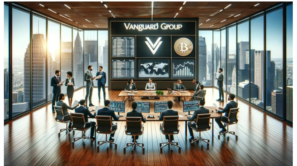
Vanguard Group: la empresa de la familia Rothschild, al servicio del sionismo y sus aventuras expansionistas.

La puesta en marcha de la Dirección Nacional de Informaciones Israelí y su política de Hasbará, con presupuesto secreto ha significado, por ejemplo, la creación de entidades que comenzaron a operar en todas las regiones del mundo, con especial énfasis en África y América latina. Esto, porque el Lobby Judío en Estados Unidos, Francia e Inglaterra tiene tal poder y manejan medios de comunicación tan evidentes, que determinaron el enfocarse y destinar esfuerzos a aquellos gobiernos y sociedades de países donde ese lobby judío es menos fuerte y requiere forzar a los políticos de esos países y sus medios