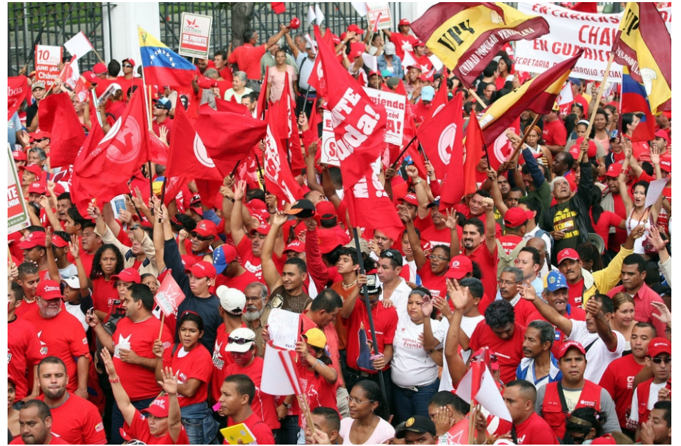
La Venezuela "roja rojita" dispuesta a no cambiar de color.

La escala del conflicto queda demostrada por la magnitud del ataque multifacético que el imperialismo lanza contra los gobiernos que no se someten a las nuevas pretensiones hegemónicas. Contra la