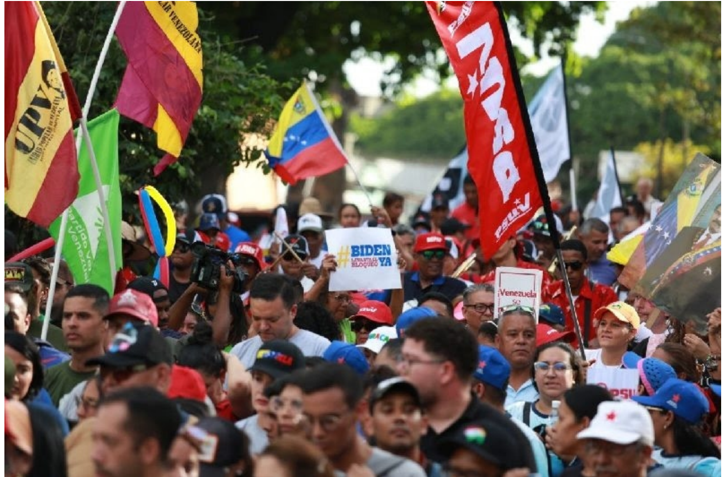
La prensa "progre" y canalla de EE.UU. acelera su campaña desestabilizadora contra Venezuela, pero el pueblo sigue firme con Maduro.

"Conozca al candidato que desafía al presidente autoritario de Venezuela", "Concursantes del reality show compiten por una canción de campaña autoritaria" y "¿Podrían las elecciones obligar al líder autoritario de Venezuela a dejar el poder?", son algunos de los encabezados de artículos publicados en las últimas tres semanas.