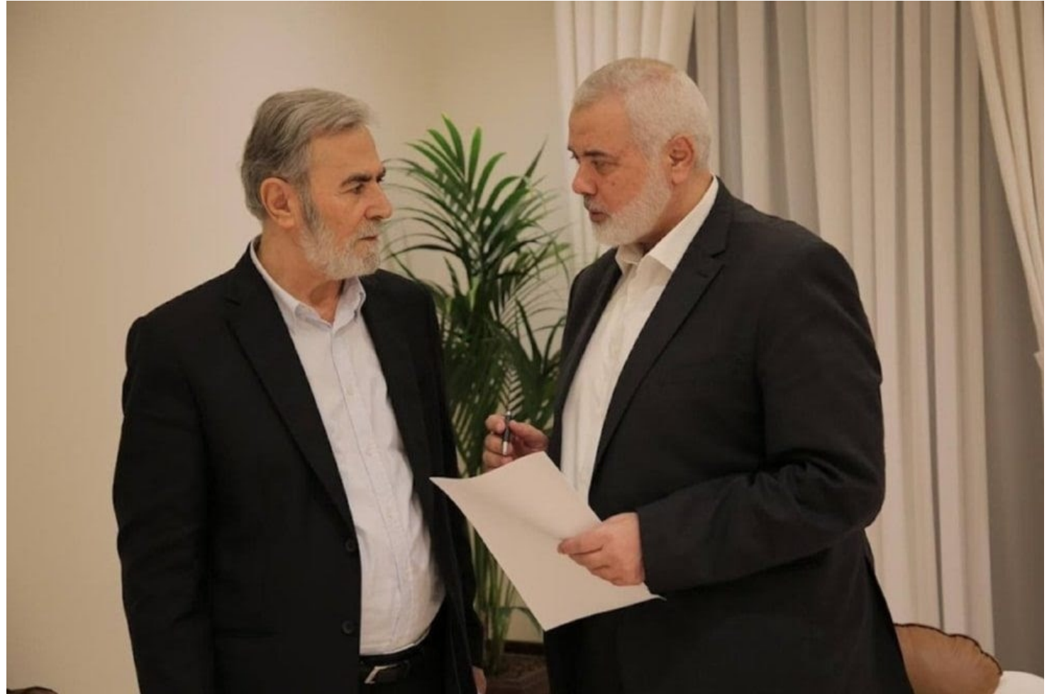
Dirigentes de la Resistencia: Ziad al-Nakhleh, de Yihad Islámica e Ismail Haniyeh, de Hamás

6. Los prisioneros palestinos liberados no serán arrestados nuevamente bajo los mismos cargos por los que fueron detenidos anteriormente, y la parte israelí no reincorporará a los prisioneros palestinos liberados para que cumplan el tiempo restante