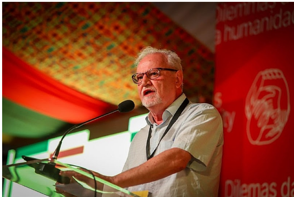
Joao Pedro: "El Gobierno Lula tiene dificultades para implementar políticas públicas"

En entrevista con O Joio y O Trigo ("El trigo y la cizaña"), el líder del MST califica con un tres la política de democratización de la tierra del gobierno federal