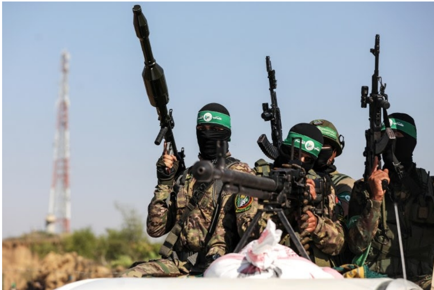
Combatientes de Hamás: la Resistencia y sus condiciones para negociar.

El canal panárabe Al Mayadeen obtuvo el texto de los principios básicos de la respuesta de la Resistencia Palestina a la propuesta para un alto al fuego que presentó el presidente de Estados Unidos Joe Biden.