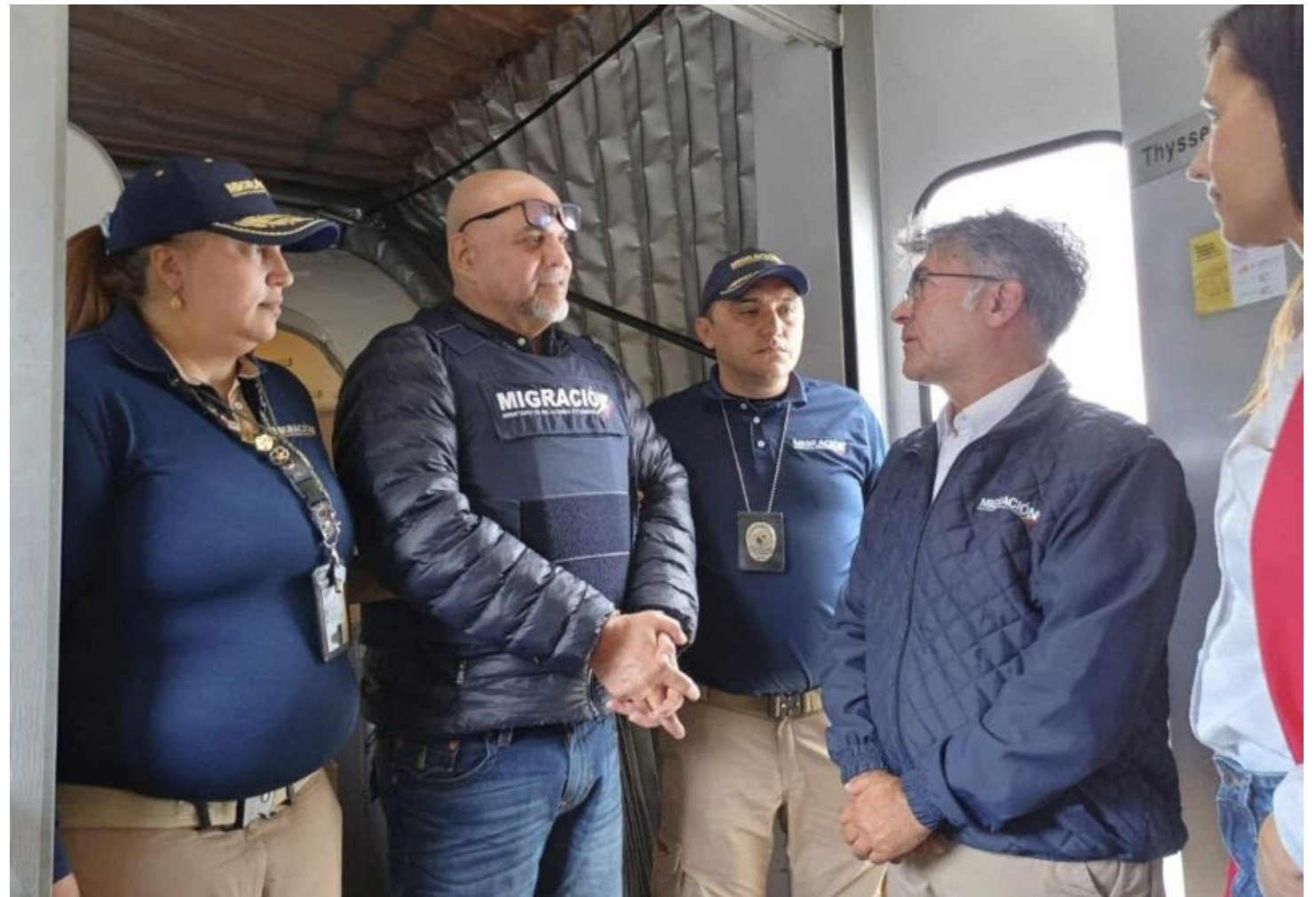
Algo anda mal: Salvatore Mancuso, capo de la mafia paramilitar, ahora convertido en “blanca paloma”.

Las secuelas son graves. Son más que todo psicológicas, pero también físicas, como fue la muerte de mi hija. En mi caso dejé un trastorno de estrés postraumático, trastorno de ansiedad y un trastorno de depresión.